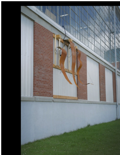
Sonia Paço-Rocchia, « 04v01 », « Lames », 2017, INTERSTICES — Un parcours d'œuvres sonores, DAIMÓN.